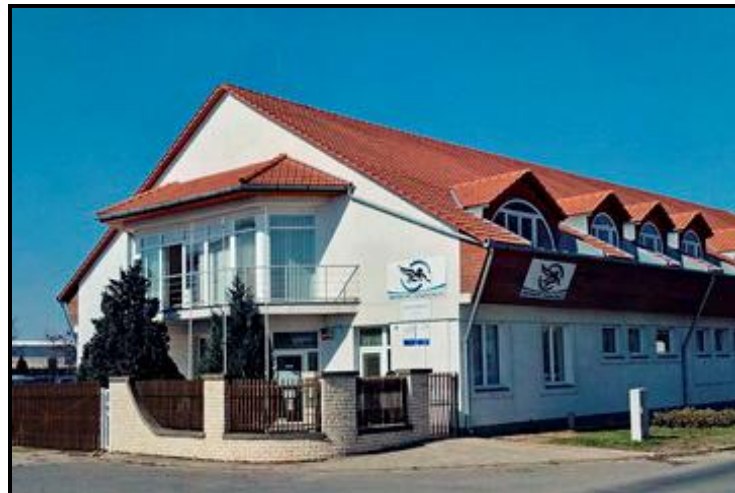
Székhelyünk: 4400 Nyíregyháza, Lujza utca 4.

A „Pro-Team” Rehabilitációs Közhasznú Nonprofit Korlátolt Felelősségű Társaság a „Pro-Team” Rehabilitációs Közhasznú Társaság átalakulásával jött létre 2009. június 16-án. A társaság székhelye Nyíregyháza, Lujza utca 4. szám alatt található. Jogelődjeinek működését is figyelembe véve - Pro Rehabilitációs Kft., „Pro-Team” Rehabilitációs Közhasznú Társaság - a cég 1996 óta működik. A jogelődök 2001-től jelentős létszámú 1800-2000 fő közötti megváltozott munkaképességű munkavállalót foglalkoztattak folyamatosan.